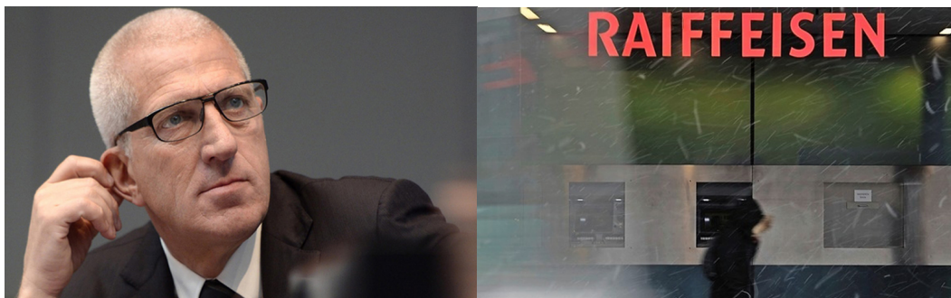
Abb. 2-9 und 2-10, Pierin Vincenz und die Bank, die er zur drittgrössten der Schweiz gemacht hat

Anmerkung: PVs Geburtszeit ist nicht bekannt, deshalb das hyp (hypothetisch) hinter der Zeitangabe. Aufgrund PVs Geschichte ist die Wahrscheinlichkeit jedoch sehr gross, dass die gewählte Zeit stimmt. Es bietet sich ein Zeitfenster von ca. 10–13h.